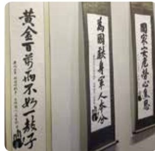
최고령 98세 소암(巢岩) 박치규 작가