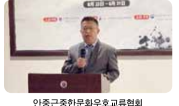
안중근중한문화우호교류협회 중국 일홍 여수파 회장

한중 수교 30주년과 안중근 의거 113주년을 기념 '2022 상하이 한중 서예전' 개막식이 지난 23일 성공리에 개최됐다.