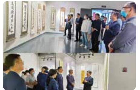
작품 설명과 라이브 방송 현장