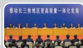
장강삼각주 지역의 더 높은 품질 일체화 발전 추진