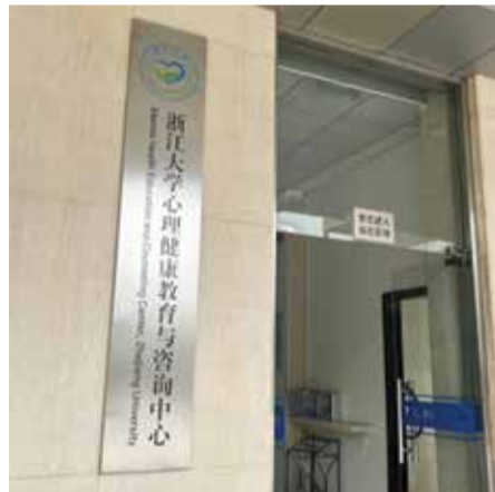
[사진=저장대학 옥천캠퍼스(玉泉校区) 심리건강치료센터]

저장대학에는 부속 병원 내 정신건강의학과와 옥천 캠퍼스(玉泉校区)에 위치한 심리건강치료센터가 있다. 저장대학 대학생이