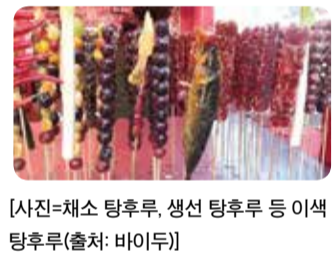
[사진=채소 탕후루, 생선 탕후루 등 이색 탕후루]

후루(冰糖葫芦)라고도 불린다. 산사 탕후루의 경우, 가운데 씨가 있기 때문에 일반적인 얇은 꼬치를 사용하면 먹는 중간중간에 씨를 뱉어야 하는 번거로움이 있지만, 간혹 아이스크림 막대에 열매를 꽂아주는 가게에서는 열매 중간을 동그랗게 도려내어 씨 없이 편리하게 먹을 수 있는 장점이 있다. 중국에서는 이색 재료를 사용한 탕후루도 판매되고 있는데, 베이징 왕푸징 거리의 전갈, 오이 탕후루와 하얼빈에서 볼 수 있는 고추, 생선, 족발, 닭발 등 탕후루가 있다.