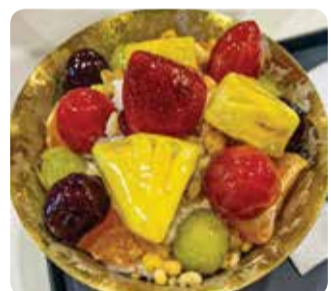
[사진=한국의 탕후루 빙수]

중국의 탕후루와 한국에서 소비되는 탕후루의 가장 큰 차이점은 바로 과일의 종류이다. 중국에서는 산사나무 열매나 딸기를 가장 많이 사용하고 특정 지역에서 밤이나 마를 넣거나 간혹 위에 참깨를 뿌린다. 하지만 한국에서는 사인머스켓, 사과어포도, 굴, 레몬, 토마토, 파인애플, 키위 등 매우 다양한 종류의 과일을 사용한다. 이러한 이유로 맛에도 차이가 있다. 산사나무 열매는 톡 쏘는, 달콤하면서 짹짹한 맛을 가지고 있어 설탕의 단맛과 적절한 조화를 이루고 밤, 마, 참깨의 맛이 더해져 고소한 맛을 낸다. 한국에서도 새콤달콤한 맛의 과일도 쓰지만, 포도류나 토마토처럼 달콤함을 극대화하는 과일들을 주로 사용하기 때문에 "달다"는 평가가 대부분이다.