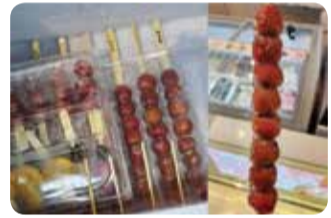
[사진=아이스크림 처럼 얼린 빙탕후루]

후루(冰糖葫芦)라고도 불린다. 산사 탕후루의 경우, 가운데 씨가 있기 때문에 일반적인 얇은 꼬치를 사용하면 먹는 중간중간에 씨를 뱉어야 하는 번거로움이 있지만, 간혹 아이스크림 막대에 열매를 꽂아주는 가게에서는 열매 중간을 동그랗게 도려내어 씨 없이 편리하게 먹을 수 있는 장점이 있다. 중국에서는 이색 재료를 사용한 탕후루도 판매되고 있는데, 베이징 왕푸징 거리의 전갈, 오이 탕후루와 하얼빈에서 볼 수 있는 고추, 생선, 족발, 닭발 등 탕후루가 있다.